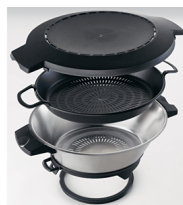
Steamer cooking set optional